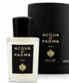
YUZU 20 ml / 0.67 f.oz. Ref. 81010