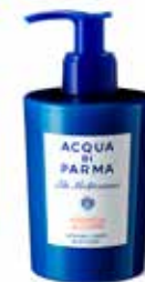
300 ml / 10 fl.oz. - Ref. ADPO82292