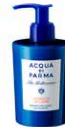
300 ml / 10 fl.oz. - Ref. ADPO82293

A soft texture designed to untangle the hair, leaving it soft and light. This gentle formula leaves the hair silky and easy to comb, and once rinsed off, leaves it lightly scented with the notes of Arancia di Capri.