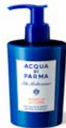
300 ml / 10 fl.oz. - Ref. ADPO82291

A lightweight Body Lotion that leaves the skin velvety and soft and envelops it in the pleasant notes of Arancia di Capri. The Body Lotion is rapidly absorbed, leaving the skin lightly scented and smooth.