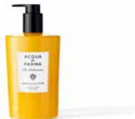
380 ml - Ref. ADPO82448