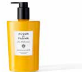
380 ml - Ref. ADPO82449

A soft texture designed to untangle the hair, leaving it soft and light. This gentle formula leaves the hair silky and easy to comb, and once rinsed off, leaves it lightly scented with the notes of Arancia di Capri.