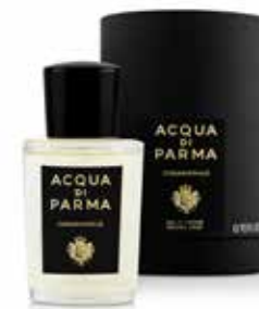
OSMANTHUS 20 ml / 0.67 f.oz. Ref. 81000

Signatures of the Sun in 20ml travel sizes bringing the universe of artistic compositions on-the-go with you.