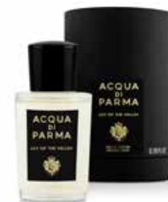
LILY OF THE VALLEY 20 ml / 0.67 f.oz. Ref. ADPO81120