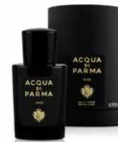
LOUD 20 ml / 0.67 f.oz. Ref. 81050