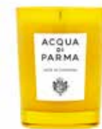
CANDELA/CANDLE 500gr Ref. ADPO62071