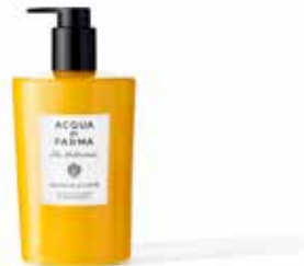
380 ml - Ref. ADPO82447

A lightweight Body Lotion that leaves the skin velvety and soft and envelops it in the pleasant notes of Arancia di Capri. The Body Lotion is rapidly absorbed, leaving the skin lightly scented and smooth.