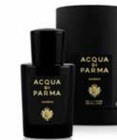
AMBRA 20 ml / 0.67 f.oz. Ref. 81070