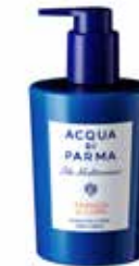
300 ml - Ref. ADPO81627

Containing shea butter, this Hand Cream melts onto the skin, enveloping it in the pleasant notes of Arancia di Capri. This Hand Cream has a fast-absorbing texture that leaves your hands soft and silky to the touch.