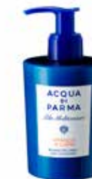
300 ml / 10 fl.oz. - Ref. ADPO82294