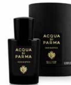
LOUD&SPICE 20 ml / 0.67 f.oz. Ref. ADPO81320