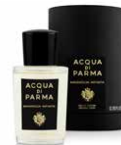
MAGNOLIA INFINITA 20 ml / 0.67 f.oz. Ref. ADPO81332